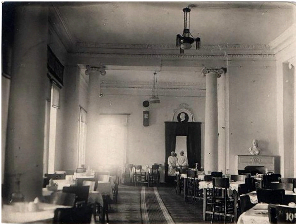
Интерьер столовой в усадьбе Никольское-Прозоровское. Помещение в стиле неоклассицизма с высокими колоннами ионического ордера, 1930-е

железобетонными...», – отмечено в справочнике «Памятники архитектуры Московской области» (1975).