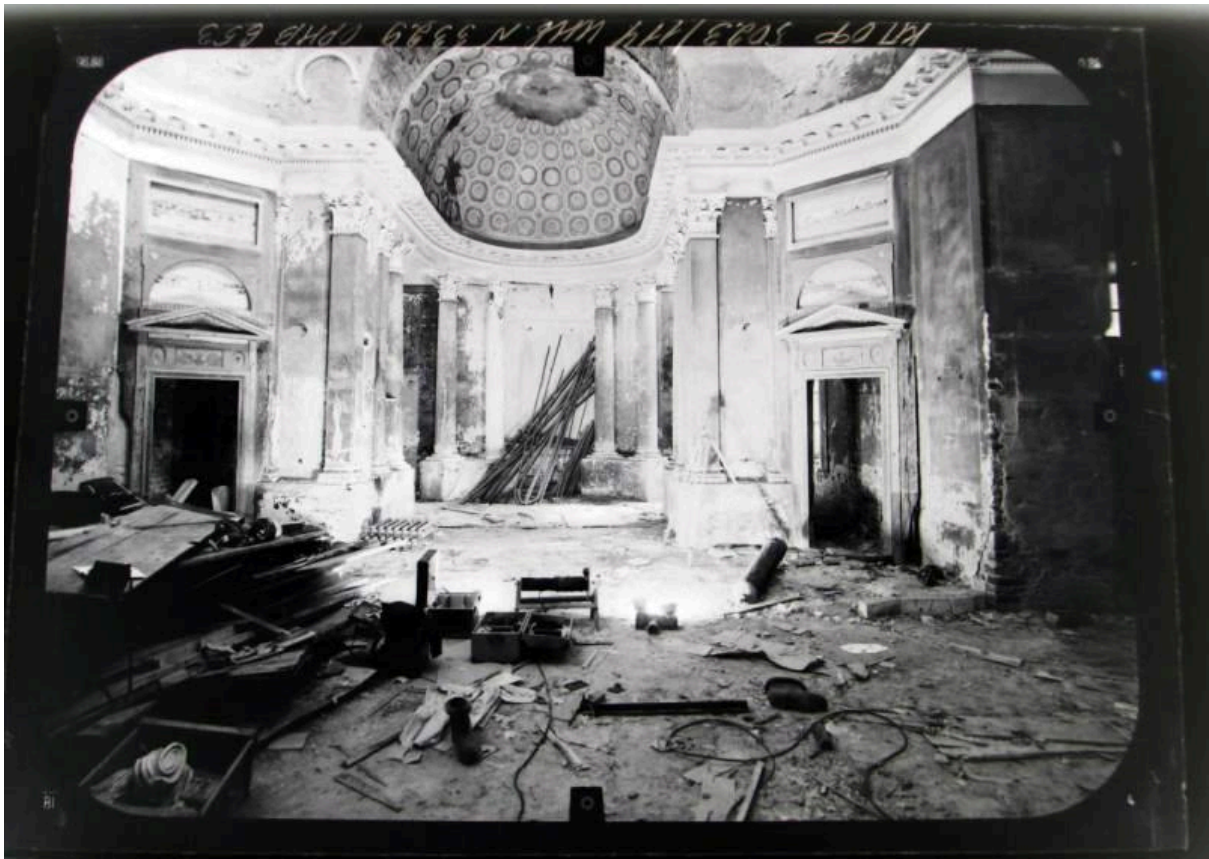
1970-е. Никольская церковь, апсида, северо-восточная стена

Ремонт и восстановление храма началось только в 1980-е годы. В 1995 году храм был взят на государственный учет как памятник истории и культуры федерального значения. Регулярными богослужения возобновились в 1998 году. В 2008 году по проекту архитектора П.П. Пенчукова на прежнем месте вновь появилось здание колокольни.